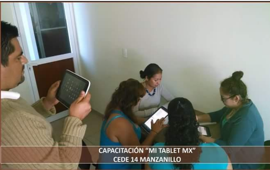
CAPACITACIÓN "MI TABLET MX" CEDE 14 MANZANILLO