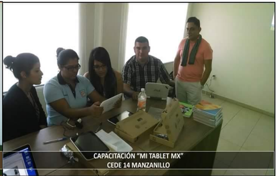
CAPACITACIÓN "MI TABLET MX" CEDE 14 MANZANILLO